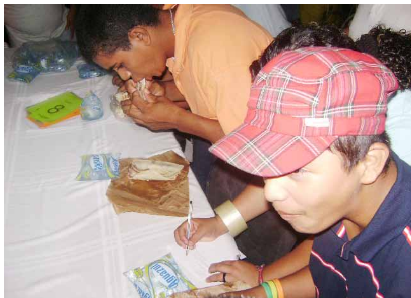
Festival de la baleada tercera edición.

La baleadas serán elaboradas por mujeres que están en la