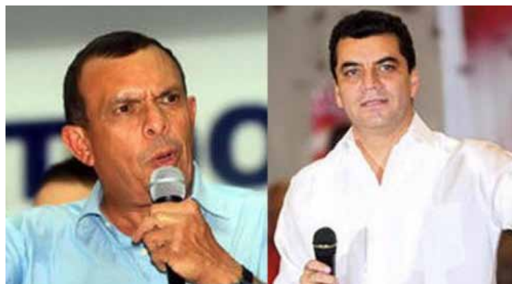
Porfirio Lobo y Elvin Santos aspirantes presidenciales.

de la resistencia, detalló que en la zona de los Valles, hay más de 48 aspirantes a las alcaldías del sector que